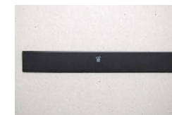
Forplade Res. Ref. JB10111