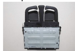
Skuffe Res. Ref.: JB10110