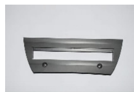
Ramme Res. Ref.: JB10105